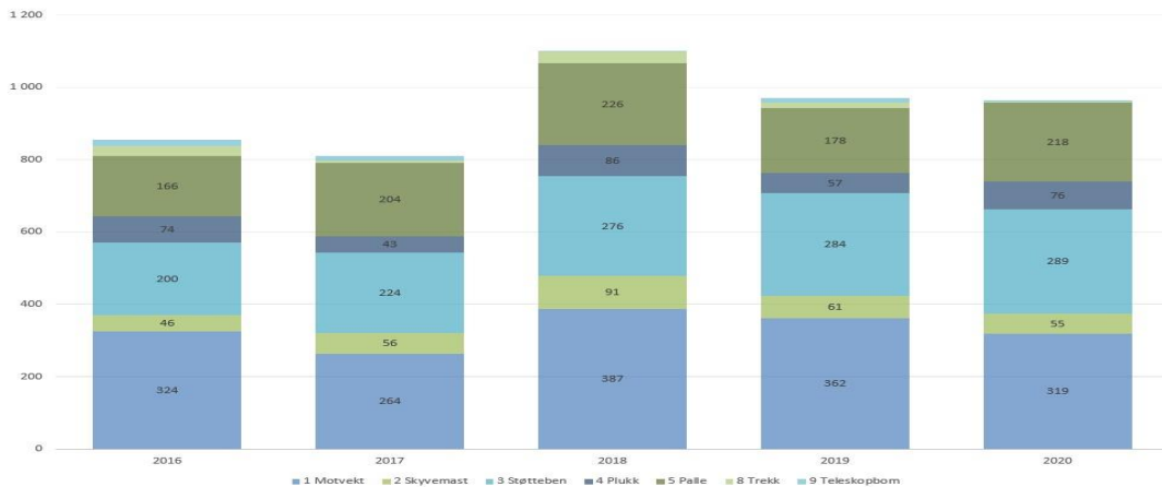
Fig. 2 viser salg per underkategori i tredje kvartal isolert f.o.m. 2016

Underkategorien støtteben har gjennom året overtatt som største kategori og dette fortsetter i tredje kvartal, som betyr at denne ender med 1.099 trucker solgt hittil i år. Mens tidligere års største gruppe motvektstrucker nå har tatt innpå og etter tredje kvartal er det totalt solgt 1.092 trucker i 2020. I tredje kvartal er det kategoriene støtteben (+2%), plukk (+33%) og palle (+22%) som har en økning, resten har en tilbakegang i forhold til samme kvartal i 2020